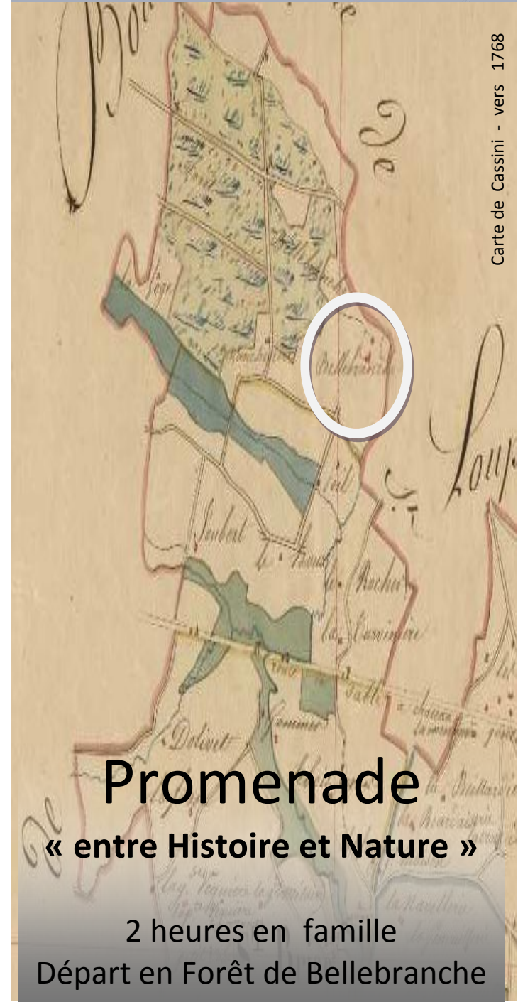
Carte de Cassini - vers 1768

Promenade « entre Histoire et Nature » 2 heures en famille Départ en Forêt de Bellebranche